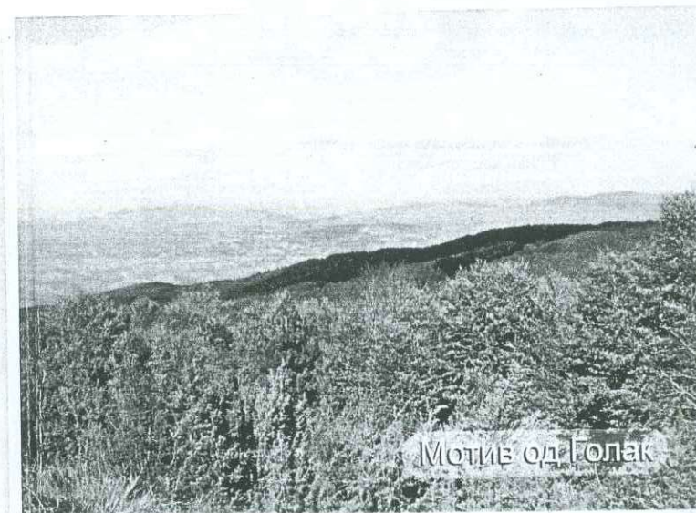
Мотив од Колак

-Економијата е оптоварена со огромните трошоци за гаснење на пожарите и обновување на шумата.